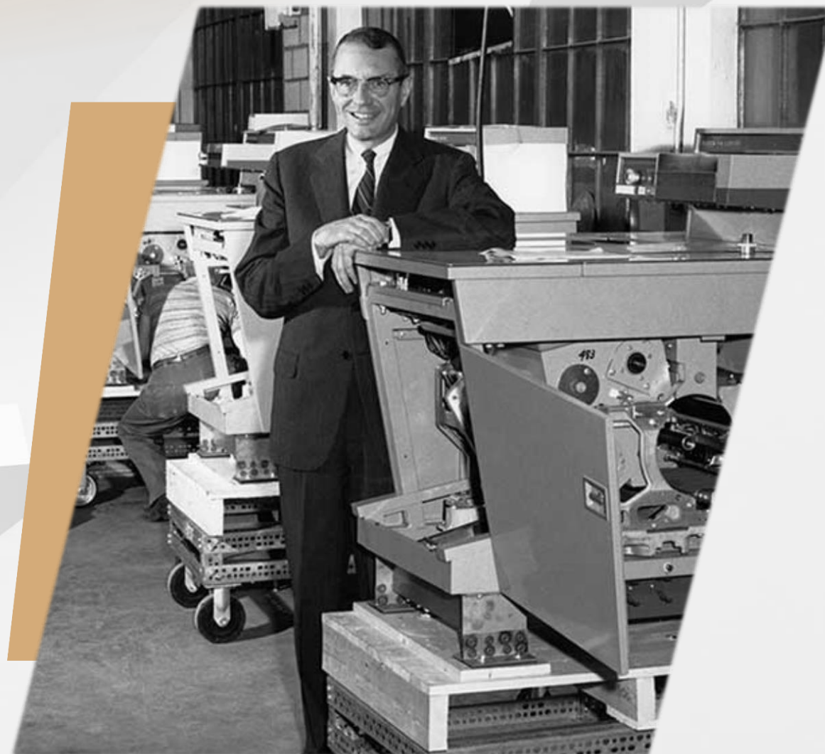
Joseph Wilson, fundador de Xerox Corporation

El primer grupo de Diversidad fue fundado por el CEO de Xerox, Joseph Wilson en los años 70 para un programa de inclusión de personas afrodescendientes que sufrían actos de discriminación al ingresar a la compañía.