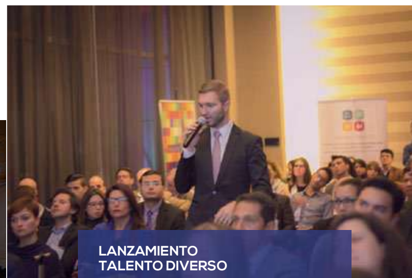
LANZAMIENTO TALENTO DIVERSO

Lanzamiento del Programa #TlentoDiverso, programa que permitirá brindar Oportunidades Laborales a la comunidad LGBTI de Colombia en empresas donde la Diversidad e Inclusión es prioridad!