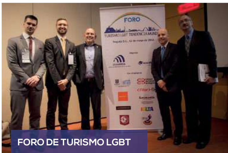
FORO DE TURISMO LGBT