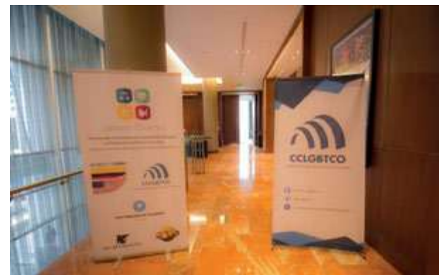
LANZAMIENTO TALENTO DIVERSO SEPTIEMBRE 2016