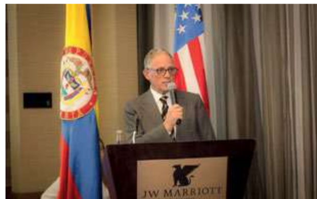
Fred P. Hochberg Presidente del Export-Import Bank of the United States (EXIM Bank), Orador Invitado.