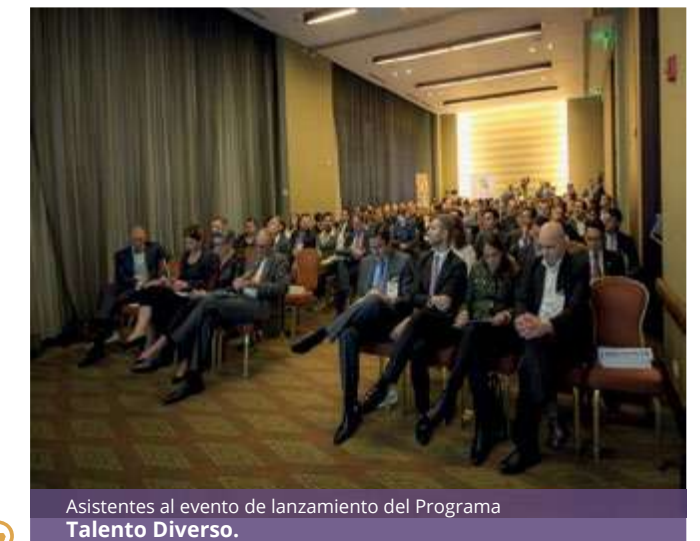
Asistentes al evento de lanzamiento del Programa Talento Diverso.